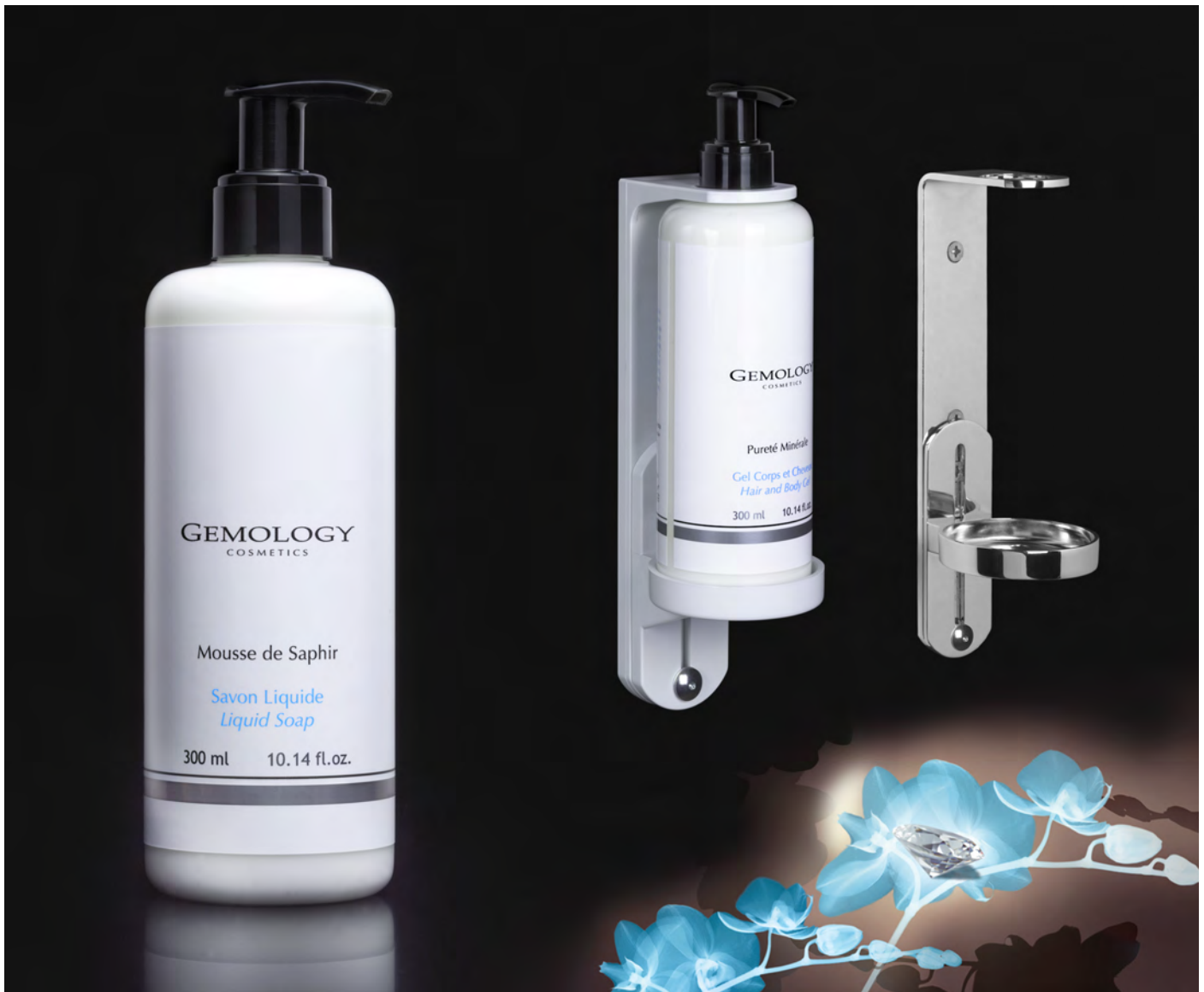
Ecopump 300 ml - 10.14 fl.oz.