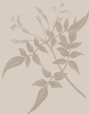
( Jasminium officinale )