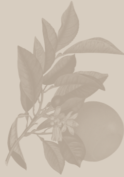
( Néroli )