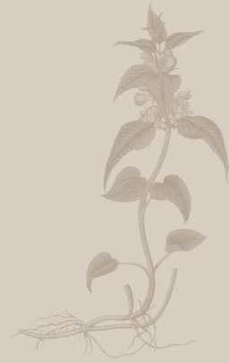
( Lamium album )