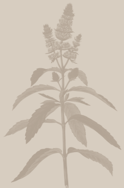
( Piperita )