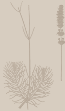
( Lavandula )