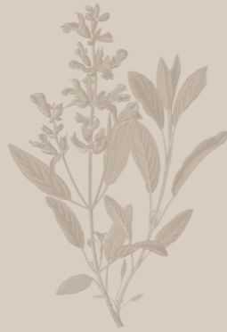
( Salvia officinalis )