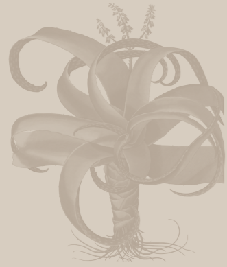
( Aloe vera )