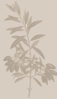
( Olea europaea )