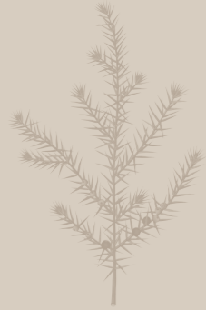
( Juniperus comunis )